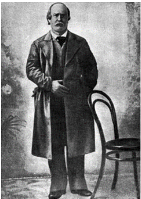
І. Карпенко-Карий в ролі Мартина Борулі («Мартин Боруля»)

Як актор Іван Карпенко-Карий віртуозно зіграв ролі Назара Стодолі з однойменної драми Тараса Шевченка, Герасима Калитки («Сто тисяч»), Терентія Гавриловича Пузиря («Хазяїн»), Мартина Борулі й Омелька («Мартин Боруля» Фото №2), Потоцького і Яна Шмигельського («Сава Чалий») з власних творів, Хома («Ой не ходи, Грицю, та й на вечорниці» Михайла Старицького) та Барабаш з драми «Богдан Хмельницький» того ж автора, сторож («Про ревізії» Марка Кропивницького).