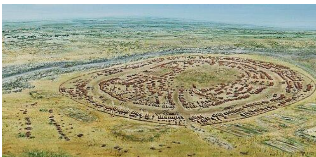
Трипільське поселення. Село Майданецьке Черкаської області.

На території України пам'ятки трипільців відомі у 15 областях, а випадкові знахідки – ще у чотирьох – всього понад 2300 пам'яток. Знахідки з цих розкопок представлені в понад 60-ти музеях України, серед них: Археологічний музей Інституту археології НАН України, Національний музей історії України, Львівський історичний музей, Одеський археологічний музей.