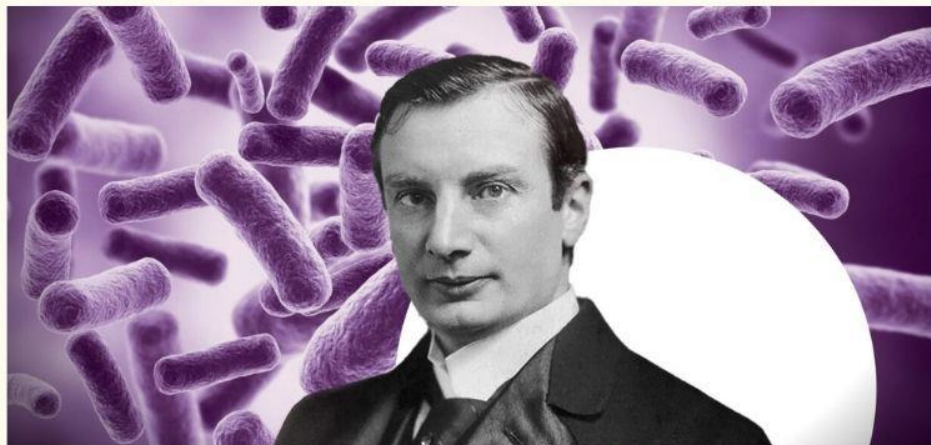
Хавкін Володимир Аронович